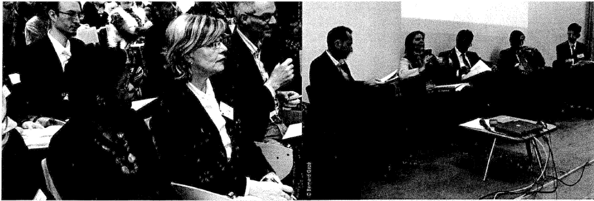
Les débats ont été ponctués des témoignages d'acteurs de terrain, responsables de réseaux gérontologiques locaux.